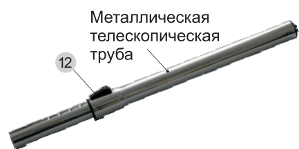
Металлическая телескопическая труба