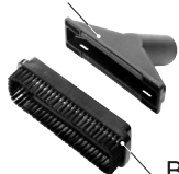
Вставка для чистки одежды